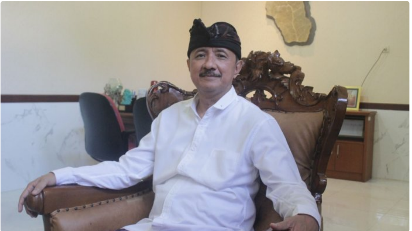
Tjok Bagus Pemayun, Kepala Dinas Pariwisata Provinsi Bali.

Oleh; Tjok Bagus Pemayun, Kepala Dinas Pariwisata Provinsi Bali